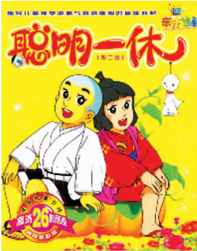
一休和小叶子背靠背,多像一对啊!

《樱桃小丸子》上的花轮也有着复杂的感情戏。只要你注意观察,你就会发现花轮最喜欢逗小丸子玩儿,对着小丸子叫“baby”才最发自内心。关于小丸子将来会嫁给花轮,简直是没有争议的事情。同时,我一直认为,小玉是喜欢花轮的。你想,小玉和小丸子形影不离,花轮调戏小丸子的时候,小玉也是被调戏的啊,长久地放电和调戏,小玉也是会对花轮产生感情的。