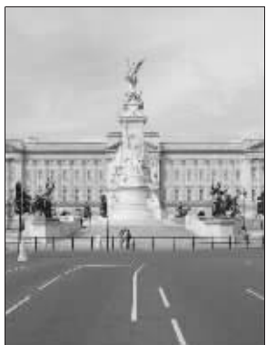
是否下雪,以白金汉宫为准

彻斯特赔率是4赔7,牛津1赔2,剑桥和伯明翰4赔9。位于苏格兰的阿伯丁圣诞节下雪的可能性较高,赔率是6赔5。 英国传统上以伦敦天气中心屋顶是否落上雪花为准判定伦敦是否有“白色圣诞节”,不过,英国气象局发言人说,今年圣诞节的颜色取决于白金汉宫。哪怕白金汉宫屋顶飘落上只有一片雪花,也算伦敦迎来“白色圣诞节”。 威廉·希尔发言人鲁珀特·亚当斯说:“我们将像鹰一样紧盯白金汉宫,那里将决定我们能不能赚到过节的钱。” 欧飒(新华社供本报特稿)