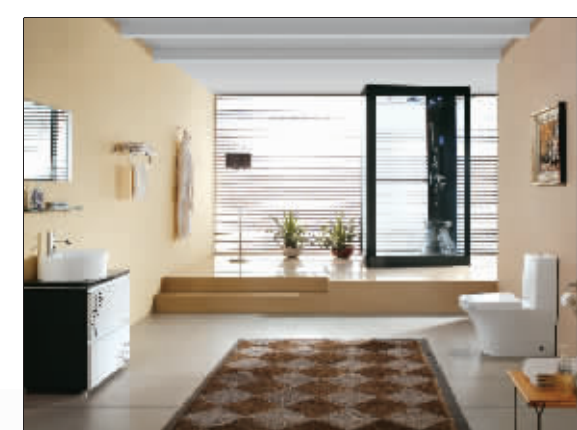
▲东鹏陶瓷做得好,洁具也不错。东鹏整体空间将瓷砖和洁具完美地结合在一起,未来将是东鹏销售的重点。图为东鹏青花瓷整体空间,将中国古典青花瓷概念表现在陶瓷和洁具上,不仅增加了古香古色的文化情趣,还给居室增添了一份温馨。