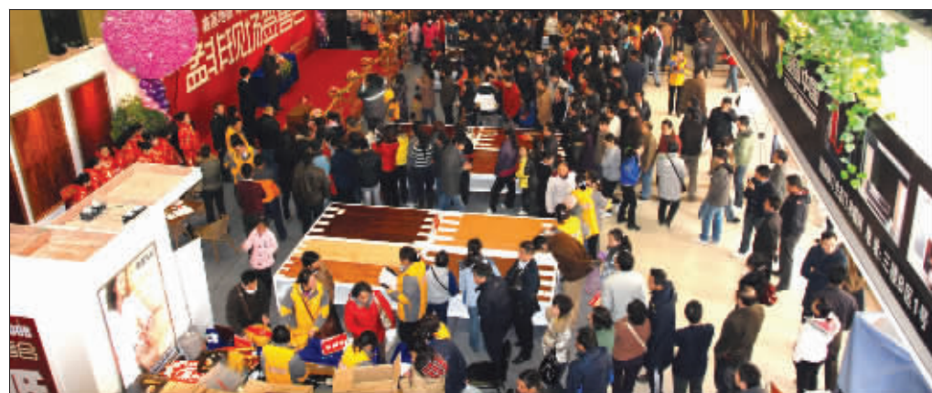
▲11月20日,鑫屋地板举行10周年庆生活动,推出数万平方米物美价廉的地板回报新老客户,让广大消费者享受了一次饕餮大餐。图为数百名消费者抢购地板的盛况。