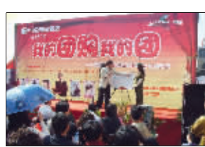
▲2009年4月,东鹏发起“我的团购我的团”促销。