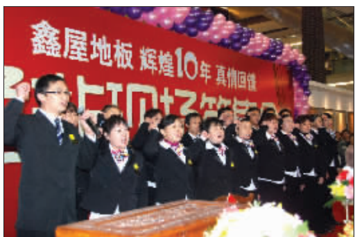
▲鑫屋地板员工在10周年庆典上进行宣誓,做到产品保质保量、服务规范。