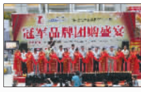
▲2009年7月,冠军联盟在红星美凯龙卡子门店举办落地活动。