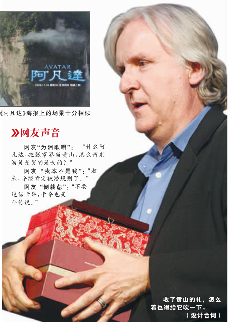
收了黄山的礼,怎么着也得给它吹一下。(设计台词)