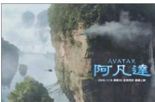
张家界的南天一柱(左图)与《阿凡达》海报上的场景十分相似