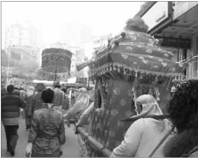
热热闹闹的中式婚礼,吸引了不少人的眼球