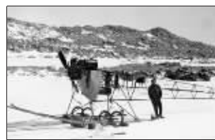
1912年南极考察资料图片 (图片中的飞机与莫森所用飞机为同一公司制造)

澳大利亚一个探险队1月2日宣布,他们发现了人类历史上第一架抵达南极洲的飞机残骸,这架飞机建造于1911年。由莫森小屋基金会组织的南极探险队表示,在此之前探险队员们已经在南极洲搜寻了三年,2010年元旦那天队员们终于找到了该飞机的残骸。