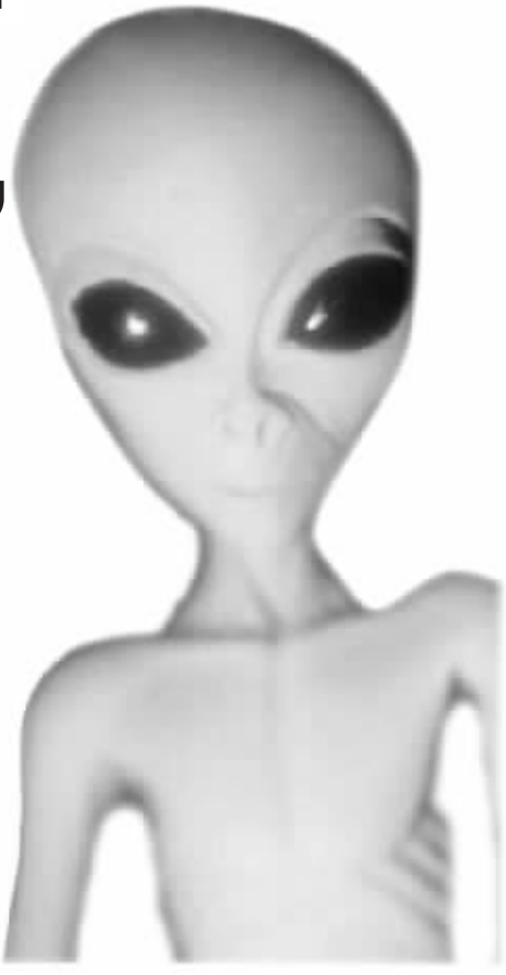
“51区”中有外星人尸体?

影般的解释之外,也有科学家给出了更为靠谱的说法。英国4频道电视台即将播出的纪录片《“内华达三角”之谜》首次对此进行了披露。