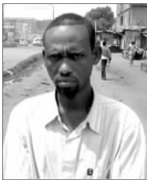
26岁的萨莫是个“退休海盗”，现在住在内罗毕。

离海盗营生做准备。他说：“海盗们不仅在内罗毕有投资，在迪拜、吉布提和其他国家也有。我是通过兄弟搞投资的，他是我在内罗毕的代理人，购置了一个很大的商铺，现在主要是卖衣服，也经营其他商品。所以我的将来在那里，而不是在海盗界。”