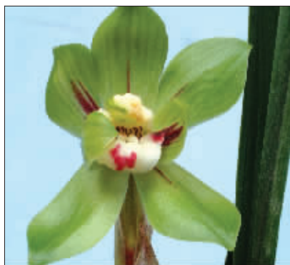
绿云,现价两千元左右一盆