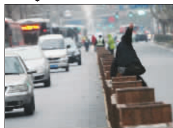
安全落地