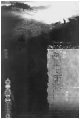
颜栋 著 江苏文艺出版社友情推荐