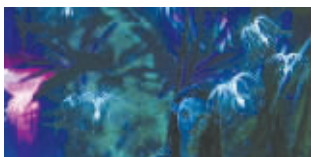
潘多拉森林(上)和赞加沼泽(下)