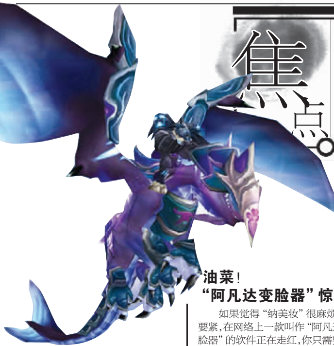
魔兽中的飞龙(右上)与阿凡达中的飞龙(左下)仿佛一对双胞胎。

《阿凡达》里面,超大的岩石山峰悬浮在空中,在云雾缭绕下若隐若现,这个场景让很多观众如痴如醉。不过,《魔兽世界》中的“风景胜地”纳格兰也拥有相似的美景,一群群小山连同绿树、瀑布都悬浮在半空中。