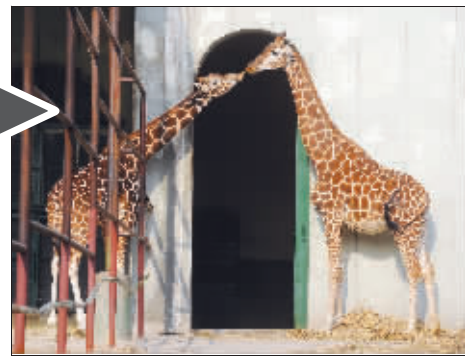
安慰妻子 “圣诞”用自己的方式安慰“纯子”