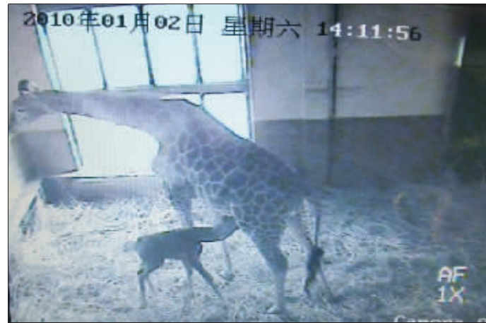
2日,鹿宝宝找妈妈吃奶(资料图片)

据了解,小鹿出生的时候是道难关;生下来之后的两小时又是一道坎,如果站不起来就活不了——前两年,有一只鹿宝宝就很明显是弱胎,没能站起来就死了。即使闯过了这两道关,还有很多未知的不确定因素,如果熬过头一个月,可以说有50%的存活希望;若能活3个月,就可说有七八成希望;活过6个月,才差不多能认为它存活成功。