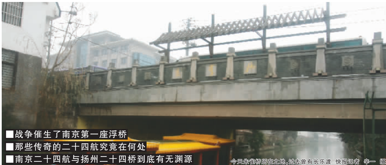
■战争催生了南京第一座浮桥 ■那些传奇的二十四航究竟在何处 ■南京二十四航与扬州二十四桥到底有无渊源 今天朱雀桥所在之地，过去曾有长乐渡

鲜为人知的是，在南京，历史上也曾出现过二十四桥，不过当时不叫桥，而叫航，史称“二十四航”。那么，这二十四航究竟是什么时候出现的呢？后来又去了哪里了呢？它跟扬州的二十四桥有关系吗？