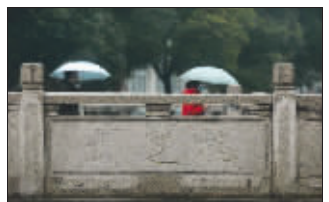
如今走在武定桥上，谁都想不到东南方曾有浮航

南京大学历史系教授胡阿祥告诉记者，秦淮二十四航有可能只是一个虚数，并不是一定就有二十四座浮航。就如同扬州的二十四桥，也是一直很有争议的，有人认为二十四桥就是指一座桥，也有人认为