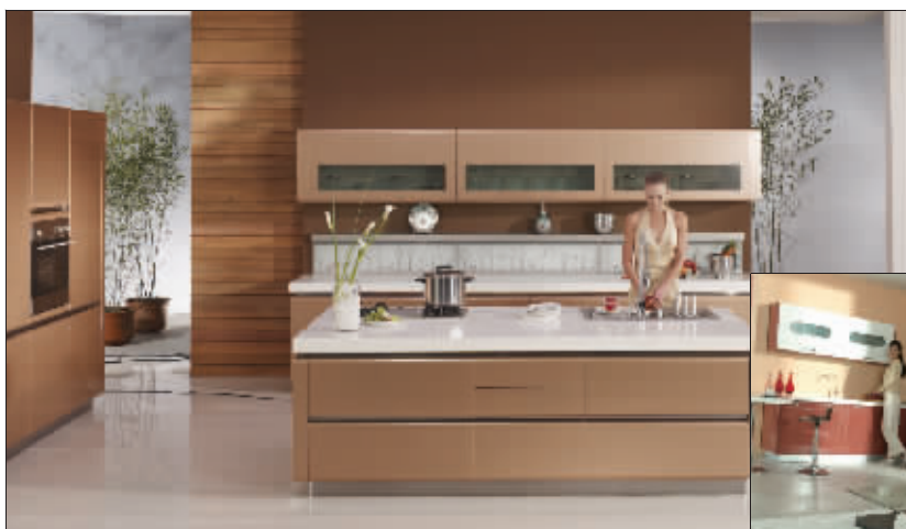
志邦厨柜的烤漆门板从加工到完成需经过18道工序

本周末(1月16日、17日),志邦厨柜第二届烤漆厨房文化节即将拉开帷幕。文化节现场,志邦厨柜将有几款最畅销的烤漆系列橱柜以最低的折扣特供业主,在最低折扣的基础上,还将赠送最高价值达1000元的功能升级产品和价值2010元的厨房电器基金。另外,主办方承诺,本次活动是志邦2010年第一场活动,优惠价格决不亚于3·15活动优惠。