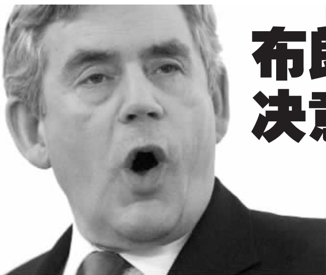
布朗:“我是首相,决心继续当首相。”