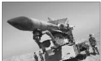
去年,伊朗军事演习中的S-200型地对空导弹。 资料图片

“我们当然可以攻击这些核设施,”他说,轰炸效果取决于发动攻击的人、炸弹性能以及攻击完成情况。 韩建军(新华社)