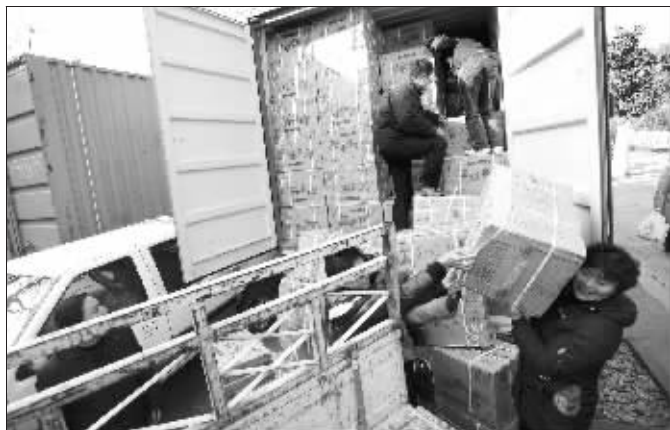
发放给特困居民的物品

了 75 万元的物资时,全场更是爆发出了热烈的掌声。这批物资里,不但有特困户过冬急需的围巾、被子等保暖用品,还包括 300 份 2010 年快报的赠阅名额,让特困户在物质和精神上都能享受到实惠。