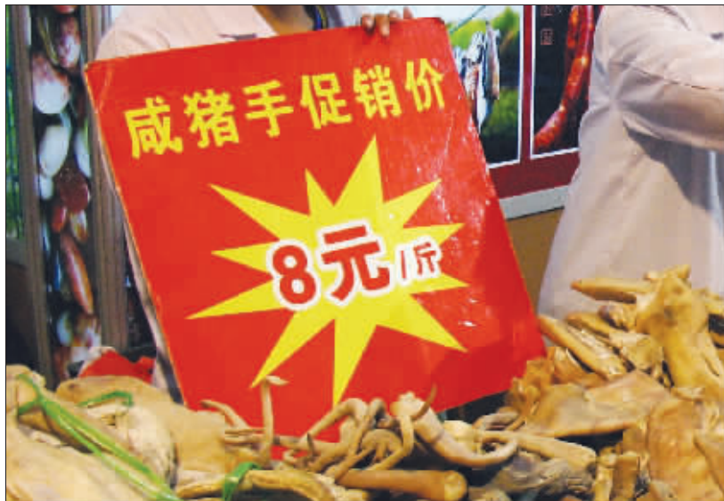
在年货大集上,一名女摊主打出的招牌令人侧目。盐猪脚、腌猪腿、咸猪蹄……写啥名不好,偏写咸猪手! (作者将获30元话费)