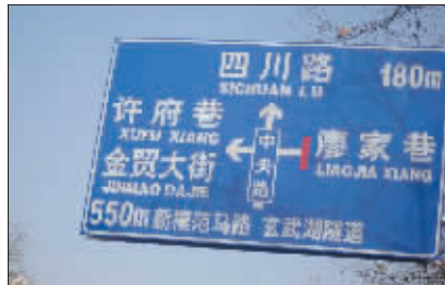
哪个对? 这两个路标,指的应该是同一条路吧,为何差距这么大呢?难道两个字通用? (作者将获30元话费)