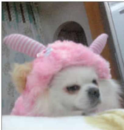
看什么看,没见过暖羊羊啊 一只名叫旺旺的小母狗,经不住主人的折腾,带着愤怒,夹杂着不屑,趁着夜黑风高,成功变身暖羊羊。也亏咱这张小白脸啊,不然就只能变成灰太狼了! (作者将获30元话费)