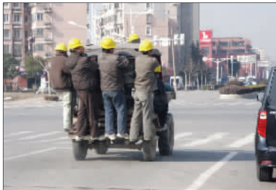
玩杂耍? 昨天中午,驾车经过河西兴隆大街与南湖路交会处时,看见一辆翻斗车驶上马路,连闯三个红灯,而更让人提心吊胆的是,车上竟然站着几个民工,还摆出各种危险造型! (作者将获30元话费)