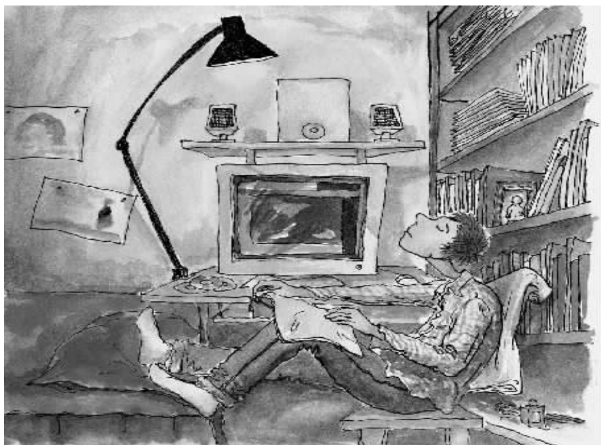
绘图/鲁嘉 插画师 美国SND插图奖获得者 已婚

广东来的兄弟推荐了一首歌《陌上归人》，粤语的，我听不懂，但曲调确实不错，特别是前面那段口琴前奏。