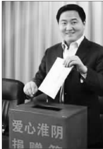
淮阴区党政领导带头捐款 中国淮阴网

尽管淮阴区委有关负责人不同意“劝富济贫”的说法,并认为是一个共建共享的过程。对于淮阴区政府发动“爱心淮阴”这个活动的良好初衷,我们也不必去怀疑。但是由淮阴区“被捐款”事件我们可以联想到,积极组建爱心专项资金固然很重要,但也不应忽视通过建立更为健全的机制,使民众充分了解政府信息,并在此基础上对政府行为进行有效的监督。