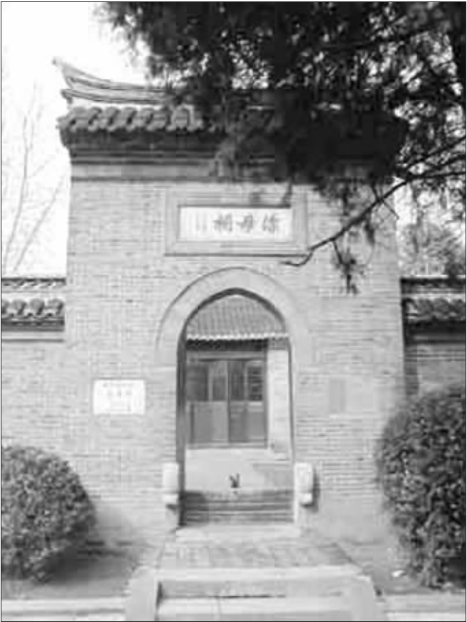
漂母祠。两千多年前,漂母与韩信演绎的“一饭千金”的千古佳话是“爱心淮阴”的历史源头和文化根源 资料图片

非家里实在困难,揭不开锅,或者有人有重病的,可以不捐款,但一定要出具户籍所在地乡镇和居委会出具的困难家庭证明。