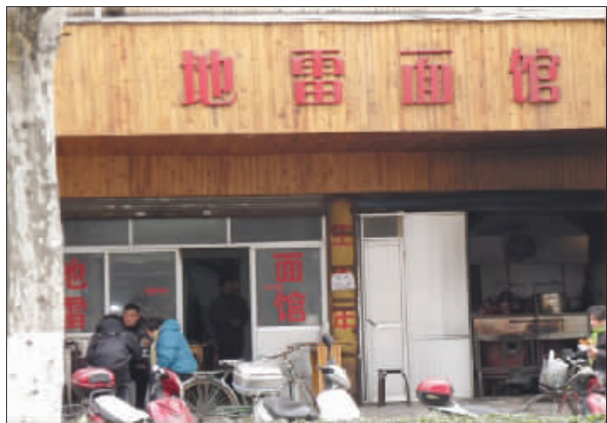
地雷面 这家面馆的名字真的很雷,因为它就叫地雷! (作者将获30元话费)