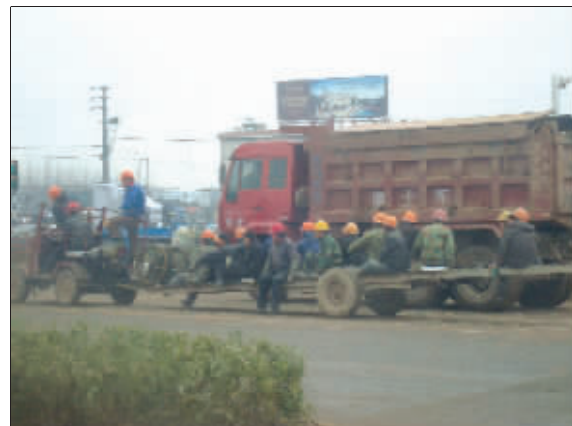
雷人拖拉机 拖拉机大家都见过,可你见过能拖这么多人的拖拉机吗? (作者将获30元话费)