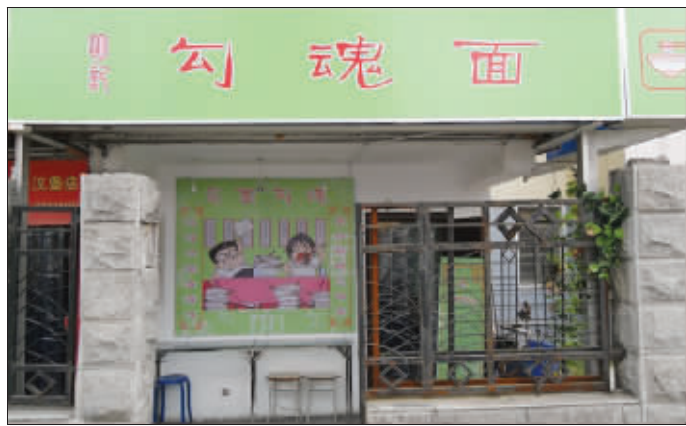
勾魂面 面条真有这么好吃,魂都会被勾走? (作者将获30元话费)