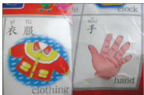
误人子弟 这本名为《好宝宝 好好学》的幼儿看图识字挂图,不仅平翘舌不分,连阴平阳平、上声去声都搞不清楚,这不是误人子弟吗? (作者将获30元话费)