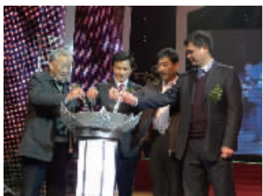
绍兴市副市长、中国宝石协会秘书长、明牌珠宝董事长及总经理共同启动新标发布仪式

加速品牌升级和实施的系列举措,势必对国内市场造成冲击,引发连锁反应,使更多的企业认识到品牌才是参与市场竞争的利器。