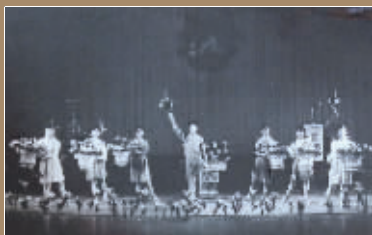
崔星洲魔术表演的现场照片之一