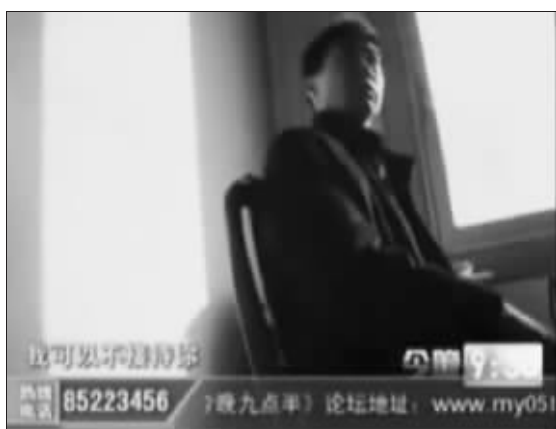
镇江电视台《今晚九点半》节目的暗访画面