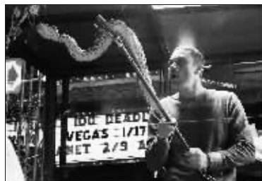
唐纳德计划与100条毒蛇共处10天