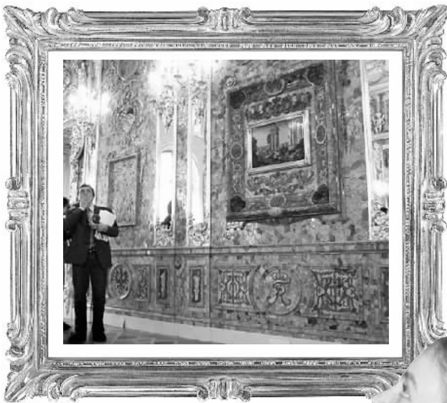
游客参观位于俄罗斯圣彼得堡市凯瑟琳宫的“琥珀宫”复制品

纳粹德军1941年入侵苏联后,他们将琥珀宫拆卸下来,装满27个箱子运到了德国东普鲁士的科尼斯堡城堡中,那儿是世人所知“琥珀宫”最后停留的地点。