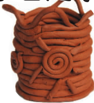
陶艺作品《陶罐》郝言 南京市第一幼儿园