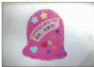
崔予 5岁小女生 崇安中心幼儿园中二班

momo 今年上小班,没有参加过任何绘画班。这是和妈妈在家随便画的《大风车》,妈妈觉得这么个小人能静下心来坐四五十分钟做一件事,本身就是一件很了不起的事!