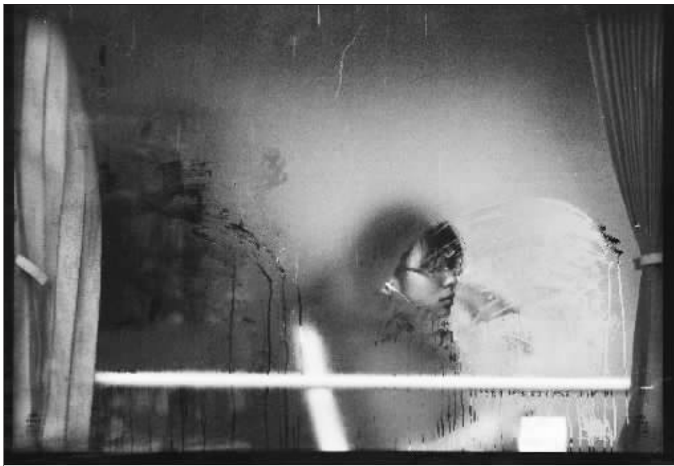
昨天,南京城气温骤降,一名女子坐在公交车内,车窗上满是雾气。

从玄武门进入玄武湖公园,迎面就看到对面的假山上矗立着一幢白色欧式建筑,走近才发现,原来是用白色钢架搭成的,勾勒出建筑的线条。“这是辉煌之门。”负责安装现场的李经理介绍。向左就转入了梦幻走廊,也就是最长的一条时光隧道,两边的白色铁架已经安装了大部分,高达十多米,可以想象,整个450米的长堤全亮起来的时候,一定梦幻至极。现场,工人们正在安装梁洲上的小型时光隧道。据了解,这些光雕建筑最近几天就将完工。