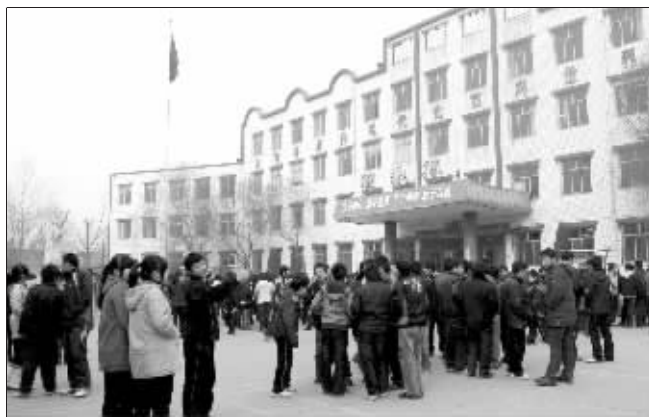
临汾一学校紧急疏散学生

据了解,这次地震是近五年来,山西省发生的第二次四级以上地震。第一次是在去年3月28日,忻州原平曾发生4.2级地震,打破了该省长达1352天