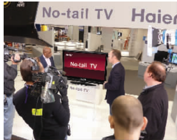
CES展海尔推出全球首台“无尾电视”

刚刚获得全球白电第一品牌的海尔,在2010年将为消费者提供凝聚时代性、国际性和超值性的产品和服务,引领2010年家电市场“成套化”、“低碳化”、“个性化”、“智能化”的趋势。