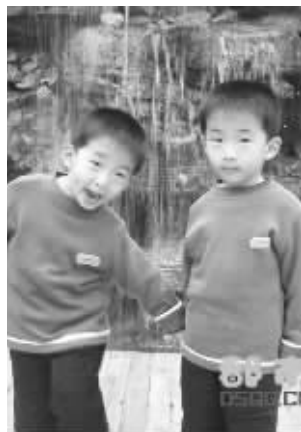
15号双胞胎宝宝 双子

关于教育内容和教育措施,卢梭根据其自然教育主张,出生到5岁这一阶段的教育,以儿童身体的养护为主,父亲为教师,母亲为保姆。必须注意儿童的健康。凡是违反儿童天性,妨害儿童身体发育,限制儿童心灵自由