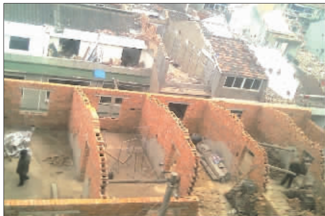
房顶上多出了几间新房

一边在大片拆迁,另一边却在加紧扩建,自家院子、房顶只要能用的地方都扩建成房;原本二层小楼变成三层,三层小楼变成四层。放眼望去,灰白旧房与红砖新房相映成趣。这一情景已经成了拆迁工地一个独特的“风景线”。近日,北环新村倪王村拆迁工地附近也是这般繁忙景象。城管部门表示,居民加盖起来的房子没有办理相关手续都属于违章建筑,必须全部拆掉。