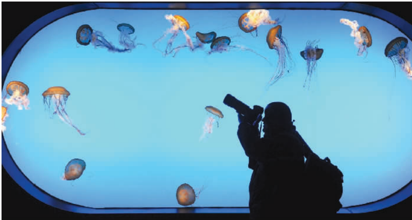
太平洋海刺在与摄影师“躲猫猫”呢

南京市儿童医院肾脏科主任张维真提醒广大家长,如果发现孩子早晨睡醒时有眼睑水肿、小便泡沫多,另外出现不明原因发热、贫血、多饮、夜尿多、乏力、食欲不振、生长发育落后等情况时,要及时做肾功能及泌尿系统的相关检查,从而早期诊断、早期治疗。