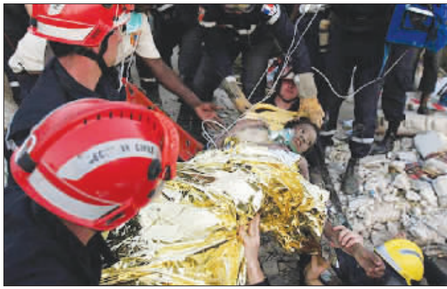
小女孩被从废墟中救出