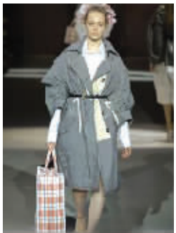
LV推出的这款拎包价格高达20000元人民币