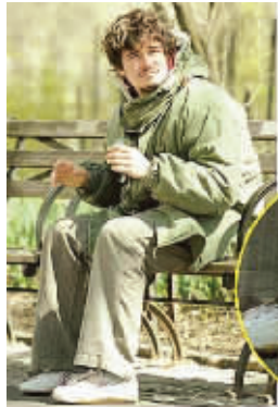
奥兰多脚上的“飞跃”鞋引人注目

自2004年以后,中国因制成歼-10和歼-11B型战斗机,对俄停止了战斗机采购,造成两国军贸额连年出现下降。近两年来,中国为建设航空母舰又开始对俄洽购舰载机。俄方很想再打开对华销售渠道,连总统都参加了促销,亲自向中国推销苏-34战斗轰炸机。那么,中国会不会接受呢?中国未来航母究竟需要什么样的舰载机呢?《军事文摘》2010年第1期上的这篇文章将为您解答。 新阅读推荐