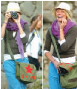
卡梅隆背着印有“为人民服务”的军用书包