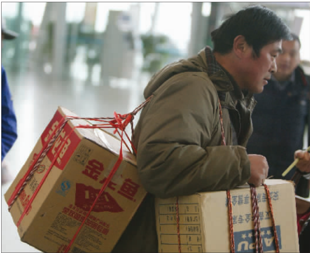
用保险柜装钱是累了点,可心里踏实

临近岁末,回家过年。南京火车站广场、售票大厅、候车室、站台……到处是漾着笑意的脸。大包、小包、麻袋……重重地压在身上,没有累,只有幸福,因为这里面不仅装着回家的期盼,也装着给家人的满满心意,有钱、有卡、有电视机……有人说,火车站是城市的缩影,列车是浓缩的城市,而行李则是居民幸不幸福的象征。