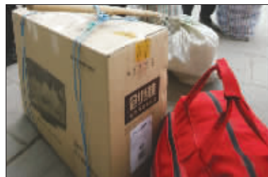
给老人带回“洋军” 液晶电视机带回家