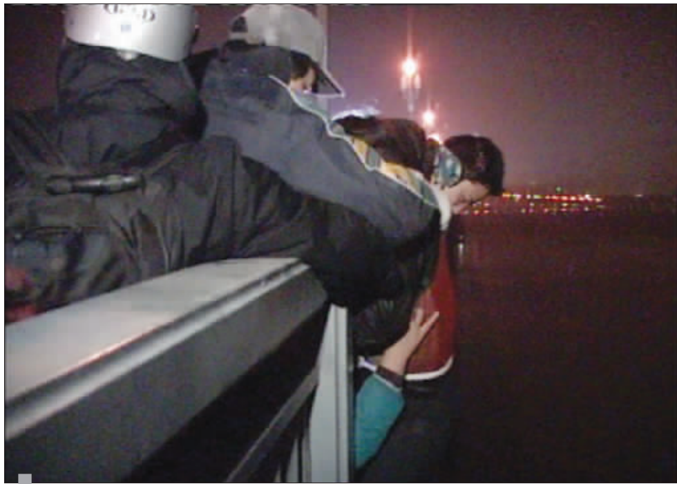
小伙子悬在栏杆外 六七双手抱住了他

(朱先生爆料奖150元) 快报记者 是钟寅 (若想了解现场情况,欢迎登录 http://tv.dsqq.cn/ ,观看快报视频新闻。)