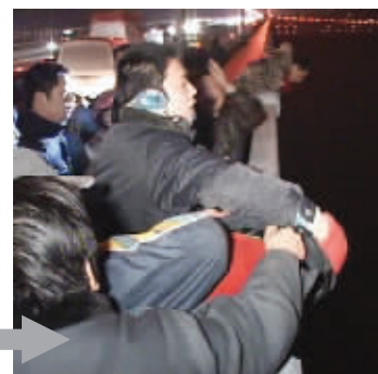
小伙子终于上来了(以上图片来自都市圈圈网视频截图)