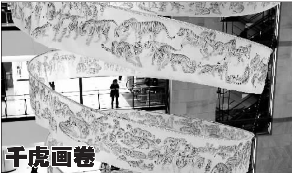
2月3日,一幅长达200米的“2010千虎画卷”亮相上海梅龙镇广场,画卷共有2010只老虎,由画虎名家肖彦卿等耗时3个月手绘而成。画卷将捐赠给上海世博会公众参与馆。

另据调查,大荔县荔华乳品公司在2008年9月至11月质监部门驻厂监管期间,对9月14日前生产的奶粉按照要求做库存与销售记录排查、清零时,销售台账记录不全,未将此前销售给马双林的20吨奶粉记入台账,造成工作遗漏,从而导致了2008年9月14日前生产的三聚氰胺超标奶粉流向社会。