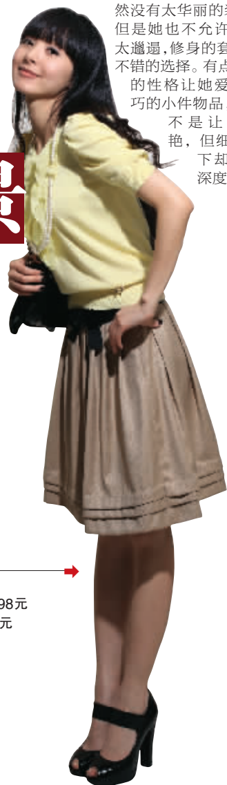
Roem 针织衫 598元 短裙 598元 包 598元

她的服装多以素色为主,虽然没有太多花色,但衣服的面料却很上档次,体现出成熟女性的高品位。虽然没有太华丽的装束,但是她也不允许自己太邋遢,修身的套装是不错的选择。有点闷骚的性格让她爱上精巧的小件物品,虽然不是让人惊艳,但细看之下却很有深度。