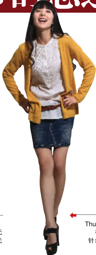
Thursday Island 衬衫 1188元 针织衫 1188元