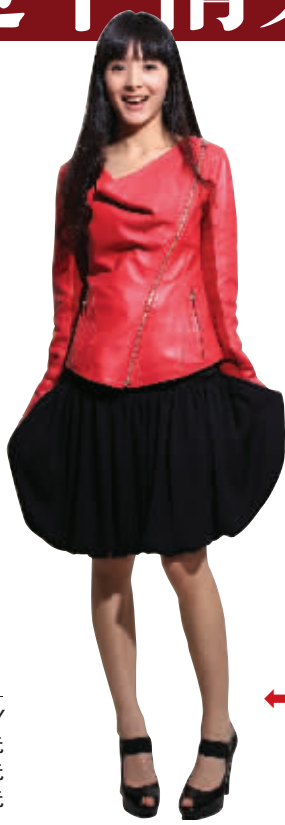
ZOOC 皮衣 4960元 短裙 1560元