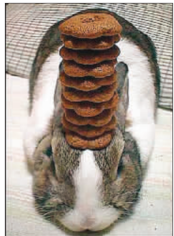
头上顶 10 块饼干也不倒

日本有只名叫“乌龙”的宠物兔子，虽然不会唱歌跳舞，却吸引了 250 万人的热切关注。原来，乌龙堪称最牛的平衡高手，饼干、卷纸、光盘等几乎任何东西放在它毛茸茸的小脑袋和双耳上，都能屹立不倒。 综合