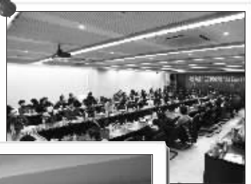
海外寻缘活动现场