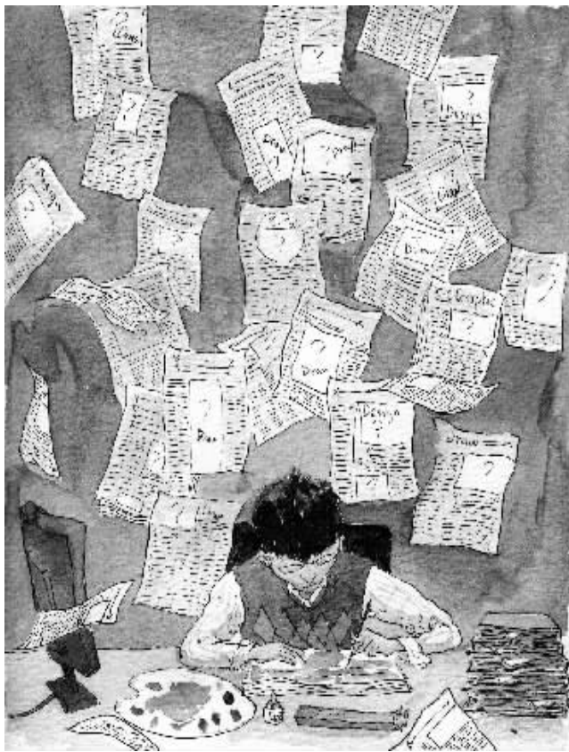
绘图/鲁嘉 插画师 美国SND插图奖获得者 已婚

直盼着过年,但是现在,我盼退休,真的!真的想退休! 诸位DIRECTOR,不要过来!再过来我就退休!