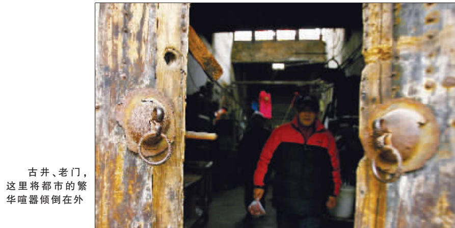
古井、老门,这里将都市的繁华喧嚣倾倒在