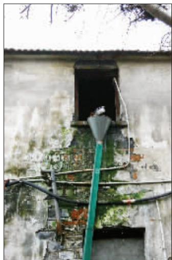
猫、鸟、两百年的楼梯、接地的排水管,这里的闲适随处可见