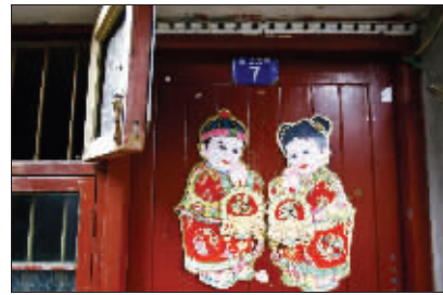
老巷里,散落着朱状元的传说