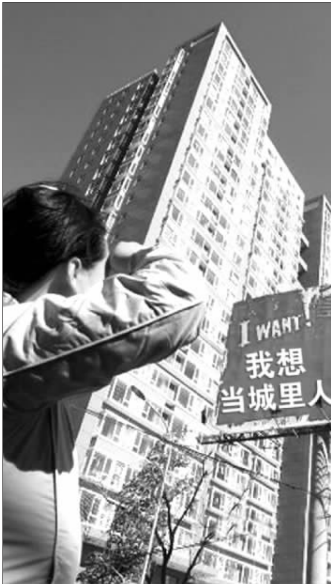
▲在城里安居了,不代表就是“城里人”。(资料图片)