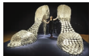
这就是那双超大高跟鞋

据英国《都市报》8日报道,当地时间10日晚7时,英国伦敦佳士得拍卖行将举行一场战后与当代艺术专场拍卖会。不过,在共计52项拍品中,一款不锈钢巨型细跟高跟鞋早早引起了竞拍者的注意。原来,这双鞋出自葡萄牙艺术家琼·瓦斯康塞洛斯,仿自性感女神玛丽莲·梦露在电影《七年之痒》中穿过的高跟鞋,长4米高3米,用不锈钢平底锅和锅盖拼接而成,估价10万至15万英镑。