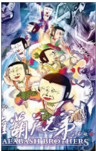
葫芦娃“叫兽”版封面