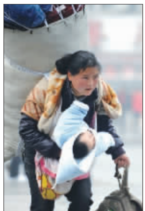
让网友泪奔的一张照片

日前,微博上一张步履蹒跚的母亲的照片引发众多网友泪奔(快报1月31日封面曾刊发)。据网友介绍,这是一位母亲身背巨大包袱,左手提大包,右手抱婴儿正在赶火车。一位知名网友称,春晚应该把这位母亲请上去,这是最鲜活的故事。张含韵转发该图片说,“不知道这位步履沉重的母亲挤上火车,到家了没有?”