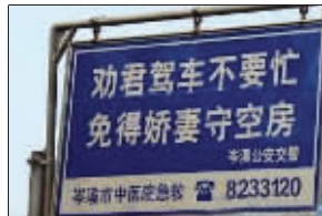
公路旁最人性的提示牌

春运开始了,关注驾车的也越来越多。日前,一张号称“最有人情味的交通警示标语”的图片在网上热传。标语称“劝君驾车不要忙,免得娇妻守空房”,这是广西岑溪市公安交警在公路旁树立的一块提示牌。很多网友盛赞这一标语,称很有人情味。不过也有网友提出疑问,“够雷的,女司机怎么办?”