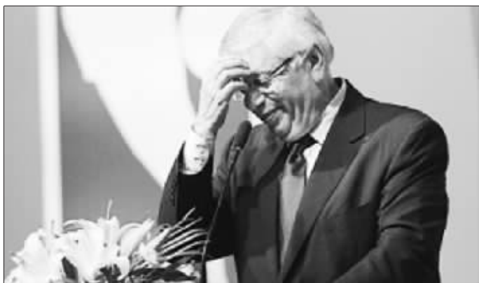
斯特恩:减你们薪水,我也很难啊!(设计台词)

或许你习惯了这样的生活,每天早上起来,总能看见科比、詹姆斯、韦德们在电视里卖力厮杀,每天中午饭后,总能看见NBA的交易、流言、口水在网站上层出不穷,每天晚上闲暇,总能看见扣篮、盖帽、抢断在五佳球里轮番上演。