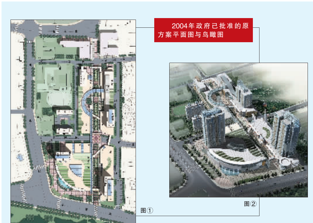
2004年政府已批准的方案平面图与鸟瞰图

2009年初,在金融危机影响最严重的不利形势下,白下区政府动员组织基层干部、拆迁、建设单位,克服困难,调集人力、资金,先行启动了该片区一期动迁工作。目前,位于该片区东北片的一期动迁任务已顺利完成。共搬迁居民170户321小户,其中37%通过产权置换、经济适用房、政府拆迁安置房等渠道改善了居住条件,人均建筑面积由23.2平方米提高到48平方米,63%居民用货币补偿购置了成套住房,消除了10多处火灾隐患,初步兑现了党委、政府让百姓早日安居乐业的承诺。