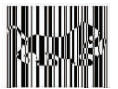
潜伏在斑马群里的大家