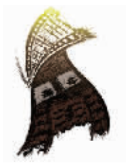
头发甩甩,大步地走开……不威风的时候,我像花猫一样温顺