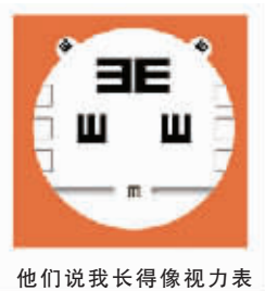
他们说长得像视力表