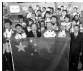
中国冬奥代表团给全国人民拜年

新华社温哥华2月10日体育专电(记者王镜宇 张寒)中国体育代表团当地时间10日傍晚在温哥华冬奥会运动员村举行升旗仪式。由于临近春节, 中国代表团在升旗仪式结束后合影留念时特意打出“中国冬奥会体育代表团祝祖国人民新春快乐”的横幅。