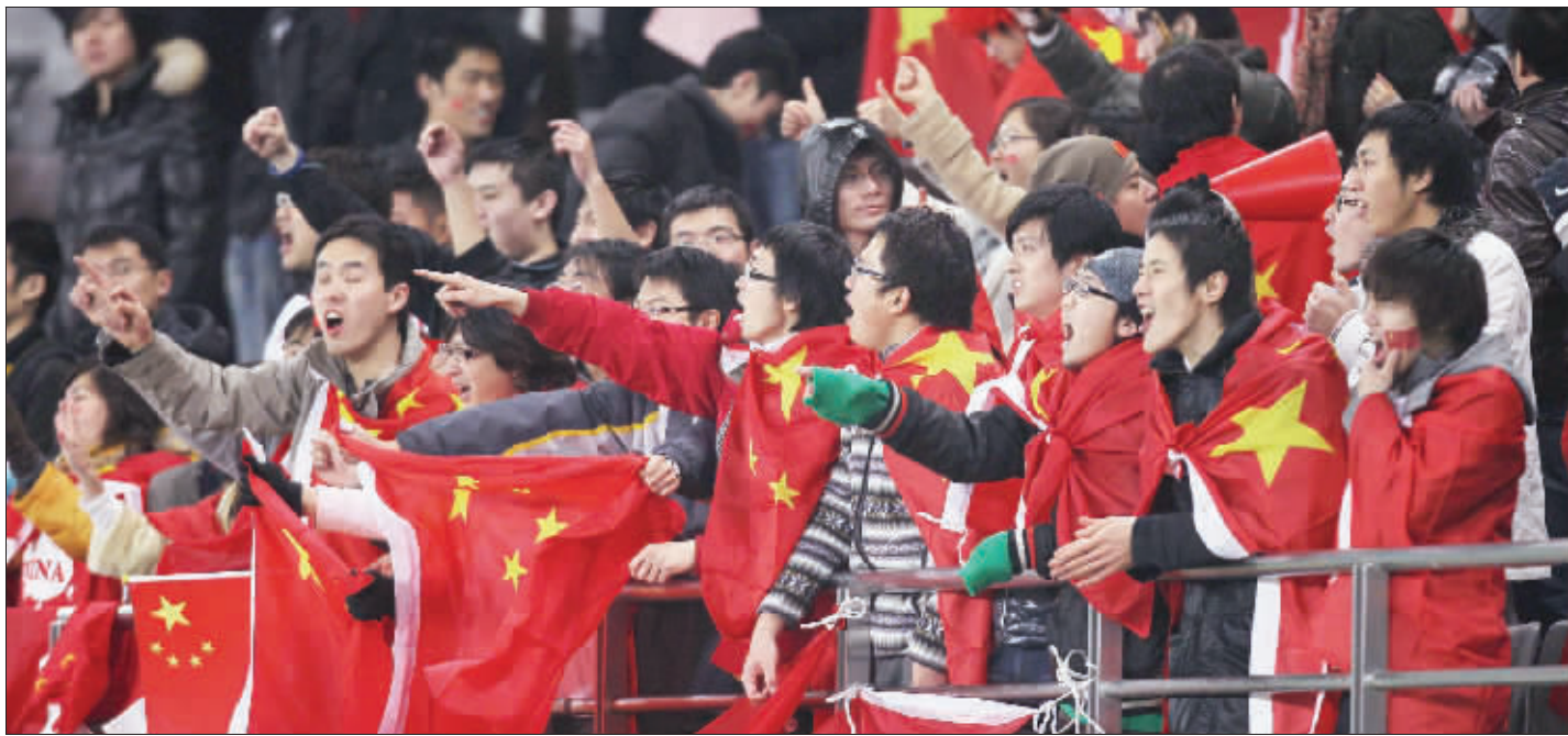
国足赢韩国队，中国球迷提前过年