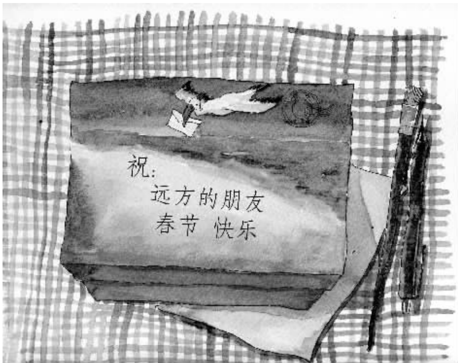
绘图/鲁嘉 插画师 美国SND插图奖获得者 已婚

爱情不是女人的主食,爱情只是女人的甜品。而甜品这东西,适量可以调剂饮食,但吃多了也不利于健康。不论是把爱情当粮食,还是把甜品当正餐,婚姻,都不会