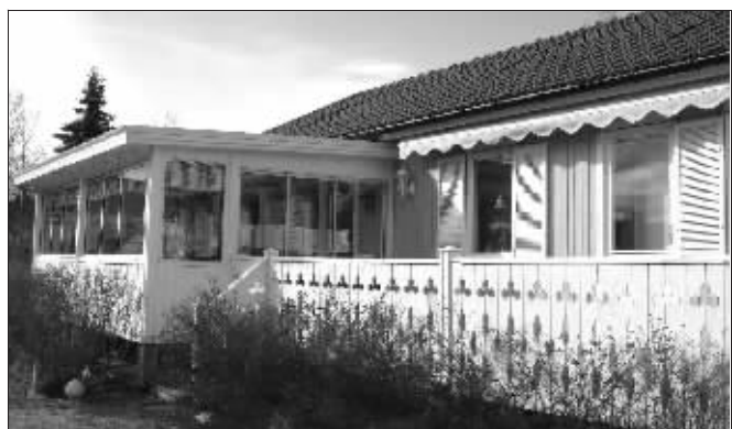
张先生帖子里的欧式别墅照片

前天,有网友在网上发帖称,准备卖掉南京的房子回家种田,“求志同道合的女伴一起回去创业”。帖子一发出,立刻有不少网友跟帖。大部分人表示支持,也有人表示质疑。